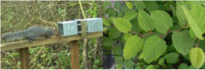
Een grijze eekhoorn aan de pil (links) Een Japanse duizendknoop (rechts)

Wageningen - In Groot-Brittannië zetten ze grijze eekhoorns aan de anticonceptie pil. Deze eekhoorns zijn exoten die de inheemse rode eekhoorns verdrijven. Ook op het continent hebben wij last van invasieve, uitheemse soorten zoals de Japanse duizendknoop. De Wageningen University onderzoekt nu een nieuwe methode om deze exoot ook aan de de pil te krijgen. Omdat een plant anders dan een eekhoorn geen mond heeft om deze te voeden moet de universiteit teruggrijpen op primitievere methoden. De volgende manieren zijn nu nog in onderzoek: