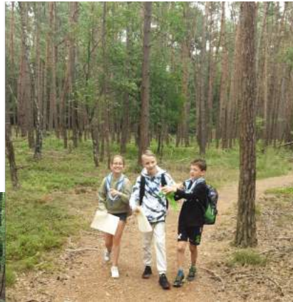
Door bossige bossen