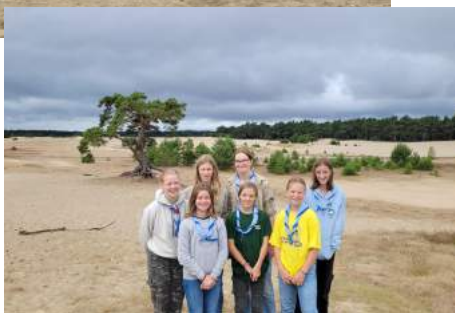
Tijd voor iets lekkers!